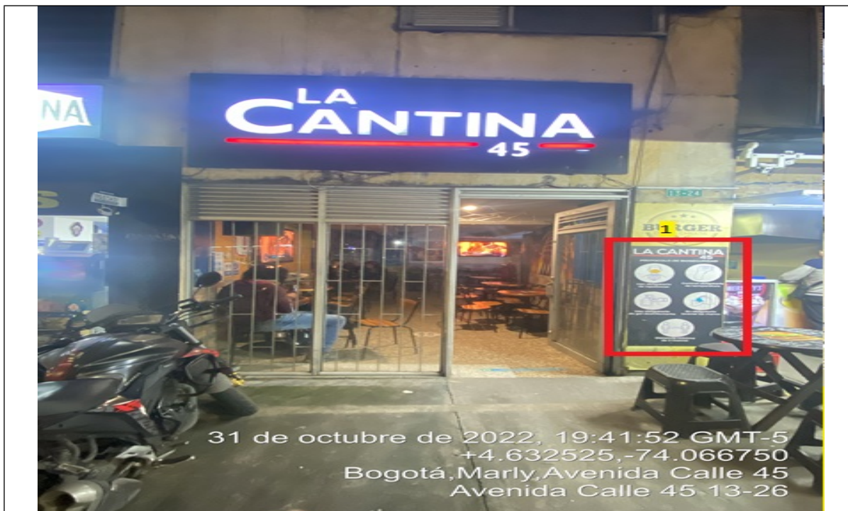
En la cual se evidencia un (1) elemento PEV pertenecientes al establecimiento comercial LA CANTINA 45 , el cual es adicional al único elemento permitido por fachada de establecimiento comercial.